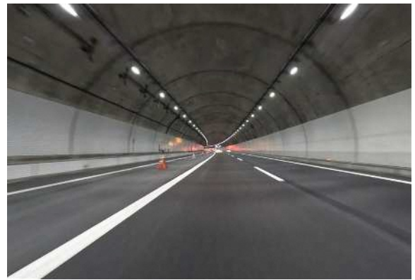
現況写真(2026年2月時点)

E1A 新名神(亀山西JCT～大津JCT(仮称))6車線化事業の詳細については、 新名神6車線化工事専用WEBサイト をご覧ください。